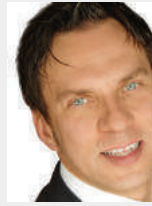
Ebert, Steffen; GIT SICHERHEIT – Wiley-VCH Verlag GmbH & Co. KGaA, Weinheim; Publishing Director